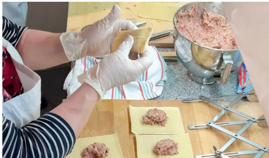
Versierte Fachfrauen fertigen die handgemachten Maultaschen.

Die Zusammenarbeit mit der DAHW Deutsche Lepra- und Tuberkulosehilfe funktioniert für die „Aktion Lepra“ der Kolpingsfamilie in Metzingen nun seit 50 Jahren, und dieses Jubiläumsjahr sollte eigentlich groß gefeiert werden. Leider musste nun das „große“ Maultaschenessen im Januar im Bonifatiusaal erneut ausfallen.