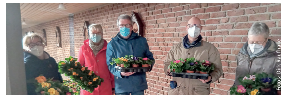
Mit 500 Primeln hat die kfd Melle 651,00 Euro für die „Aktion Leprahilfe“ erlöst.

Manche Menschen wissen nicht..... wie wichtig es ist, dass sie einfach da sind. wie gut es ist, sie nur zu sehen. wie tröstlich ihr gütiges Lächeln wirkt. wie viel ärmer wir ohne sie wären. dass sie ein Geschenk des Himmels sind. Sie wüssten es, würden wir es ihnen sagen. (Paul Celan)